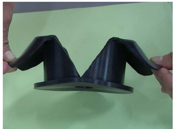
横面より（掛りの状況）