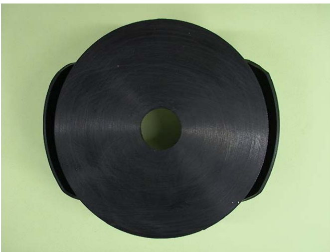
ボックス下面より

MKS ゴム蓋は鋼製伸縮装置製作のパイオニアであるミカサ金属が製造・販売している鋼製伸縮装置桁端補強ボックスハンドホール用鳥類進入防止対策ゴム蓋です。従来品はフランジとの掛り寸法が小さいことから落下の懸念がありましたが、MKS ゴム蓋はを掛り寸法を大きく改善したことにより落下しません。また、従来品は適用フランジ厚みが限られていましたが、MKS ゴム蓋は最大フランジ厚 80mm まで(Wタイプ)適用が可能です。取り付けも容易で繰り返し使用も可能な便利ゴム蓋です。